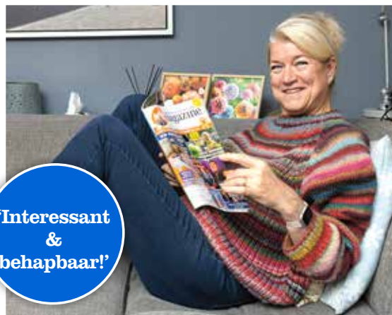
Cocky (59) uit Spijkenisse